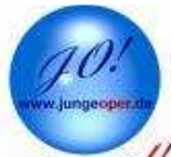
Lebt cool! Junge Oper

Am Kirmesdienstag (28.09.2010) endet der Unterricht an den Emsbürener Schulen nach der 5. Stunde. Das Mittagessen und das Nachmittagsangebot fallen aus.